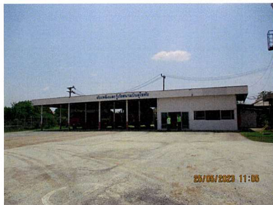
สถานีดับเพลิง