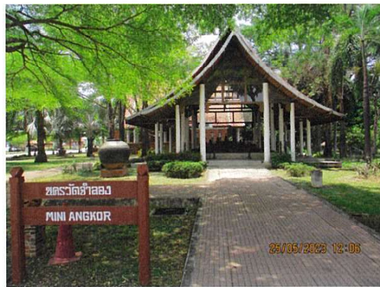
นครวัดจำลอง