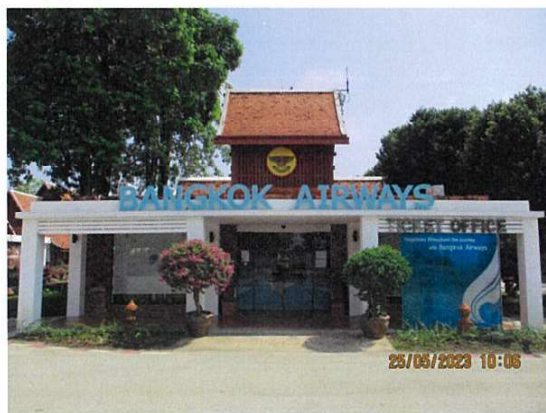
อาคารจำหน่ายบัตรโดยสาร