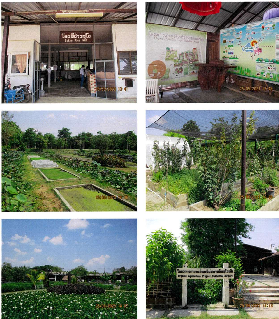
โครงการเกษตรอินทรีย์