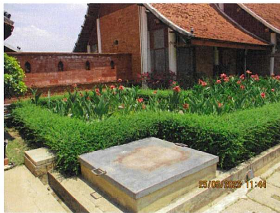
ภาพถ่ายที่ 1.6.1-2 แสดงระบบบำบัดน้ำเสียสำเร็จรูปของโครงการ บริเวณอาคารผู้โดยสารขาเข้า-ขาออก