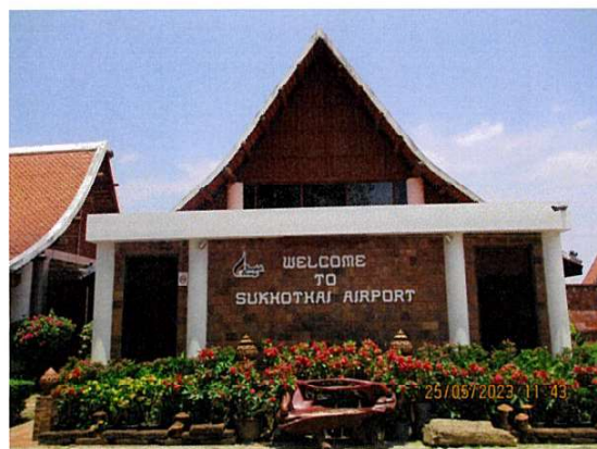
อาคารที่พักผู้โดยสาร

ภาพถ่ายที่ 1.4.2-1 องค์ประกอบต่างๆ ภายในสนามบินสุโขทัย