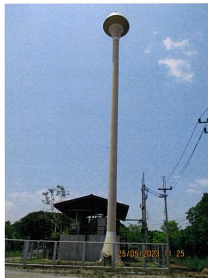
ภาพถ่ายที่ 1.6.1-1 ระบบผลิตน้ำใช้