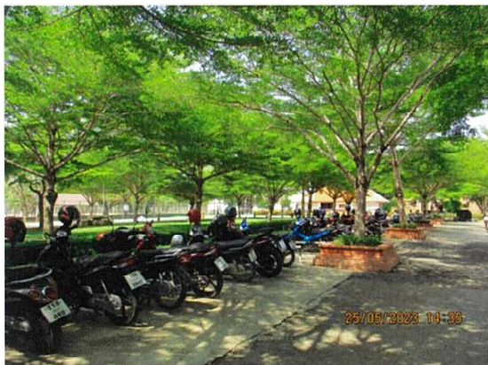
ลานจอดรถจักรยานยนต์