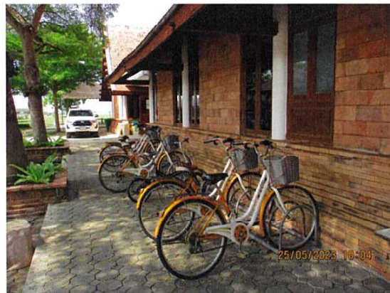
ลานจอดรถจักรยาน