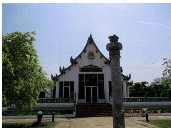
หอพระพุทธร