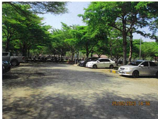
ลานจอดรถยนต์