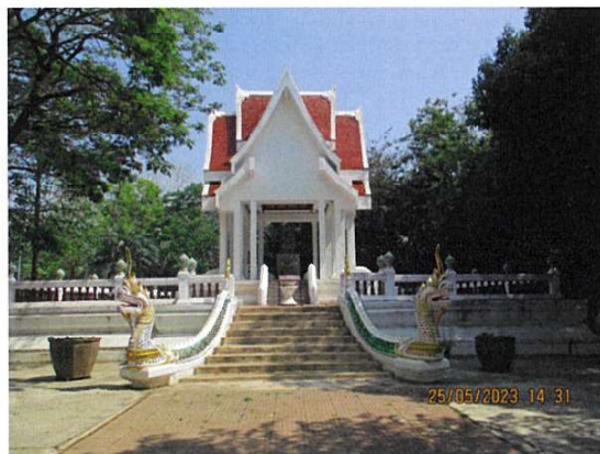
หลวงพ่อดินใจ(จำลอง)