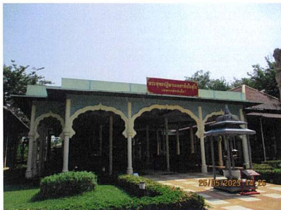
หลวงพ่อดินใจ