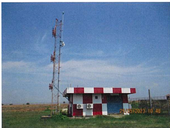
อาคารวิทยุช่วยการเดินอากาศ