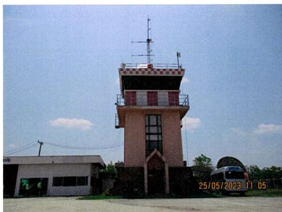
อาคารหอบังคับการบิน