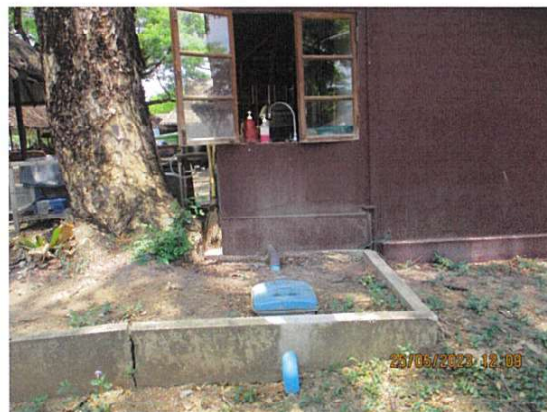
ภาพถ่ายที่ 1.6.1-3 ถังดักไขมันบริเวณร้านอาหารภายในสนามบึงสุโขทัย